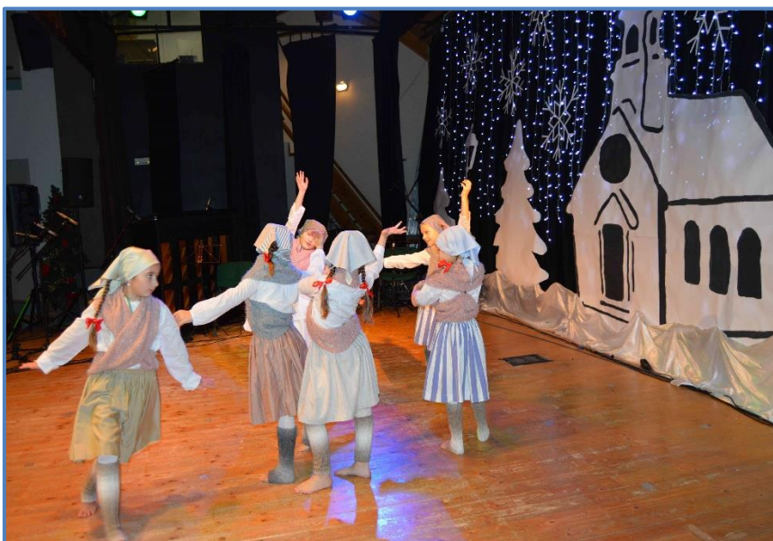
Vystoupení tanečního oboru v SCJ