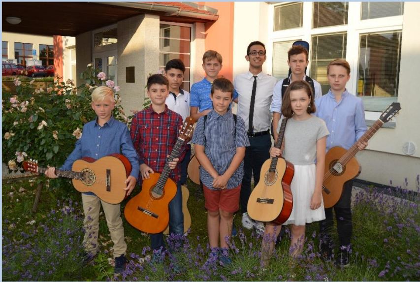
Závěrečné přehrávky žáků třídy Z. Rističe