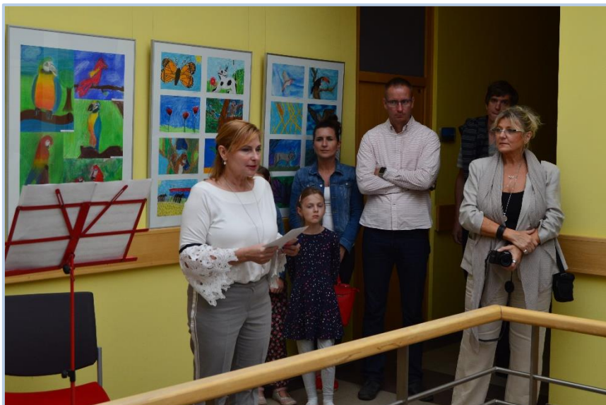
Vernisáž výtvarného oboru ve firmě Ferring-Léčiva, a. s.